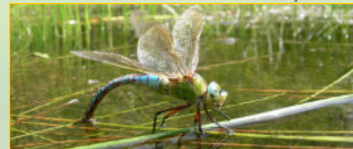
Königsibelle bei der Eiablage