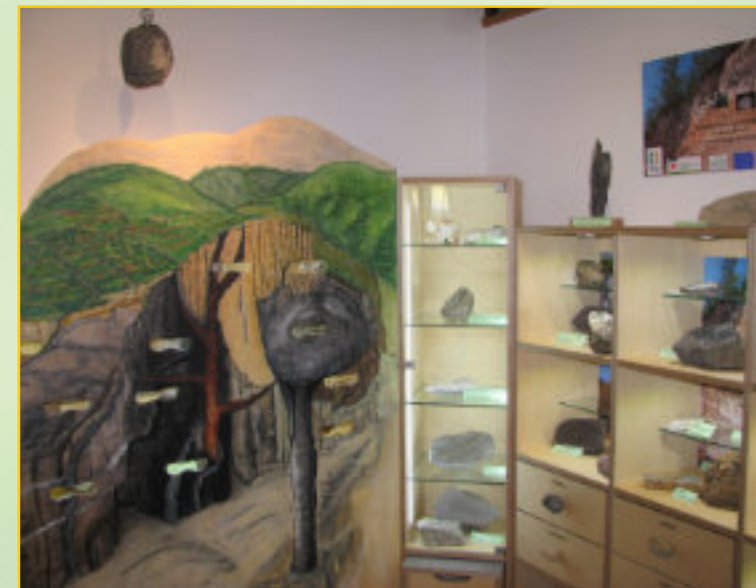
Um den Kaiserstuhl besser kennenzulernen, lohnt sich ein Besuch der Ausstellungsräume des Naturzentrums Kaiserstuhl.

Das Naturzentrum ist von März bis Oktober geöffnet.