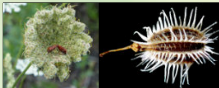
Die Wilde Möhre mit ihrem Samen im Makroformat