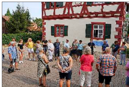
Empfang beim Üsenberger Hof in Endingen mit Bürgermeister Tobias Metz.