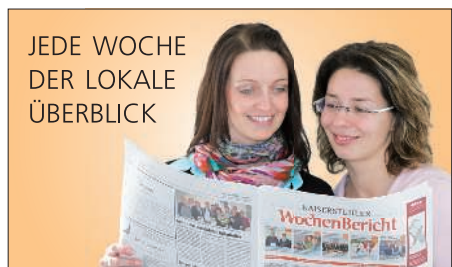
JEDE WOCHE DER LOKALE ÜBERBLICK

Das Rathaus in Forchheim hat an folgenden Tagen geöffnet: 10., 13. und 15. Juni. In dringenden Fällen wenden Sie sich bitte an die Stadtverwaltung in Endingen oder per Mail an: buergermeister@forchheim-am-kaiserstuhl.de.