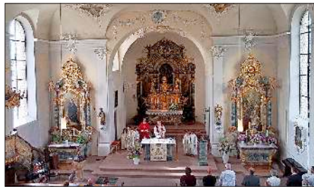
In St. Petronilla wurde ein festlicher Gottesdienst zu Ehren der römischen Schutzheiligen gefeiert.

St. Johannes Baptista Forchheim So., 12.6., 9 Uhr Eucharistiefeier. Mi., 15.6., 18.30 Uhr Eucharistische