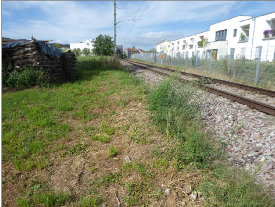
Foto 3: Kaiserstuhl-Bahnlinie als nördliche Grenze der neu auszuweisenden Gemeindebedarfsfläche (Blickrichtung Westen, Foto vom 20.08.2020).