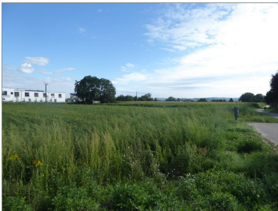
Foto 1: Ackerflächen der neu auszuweisenden Gemeindebedarfsfläche (Blickrichtung Nordost, Foto vom 20.08.2020).

sich dort eine Gartenhütte aus Holz mit einer ehemaligen Gemüseanbaufläche, ein Feuerholz-lagerplatz und eine provisorische Feuerstelle (s. Foto 2). Nördlich wird das Plangebiet von den Gleisen der Kaiserstuhl-Bahn abgegrenzt (s. Foto 3).